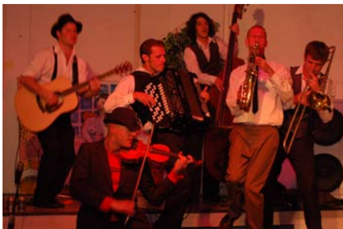
Gruppen Ränfen stod för underhållningen.