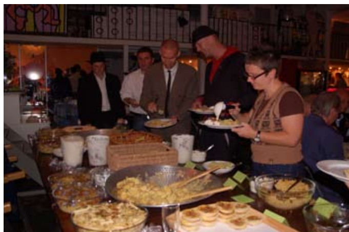
Maten som serverades var god och garanterat ekologisk, vilket glädde alla hungriga.