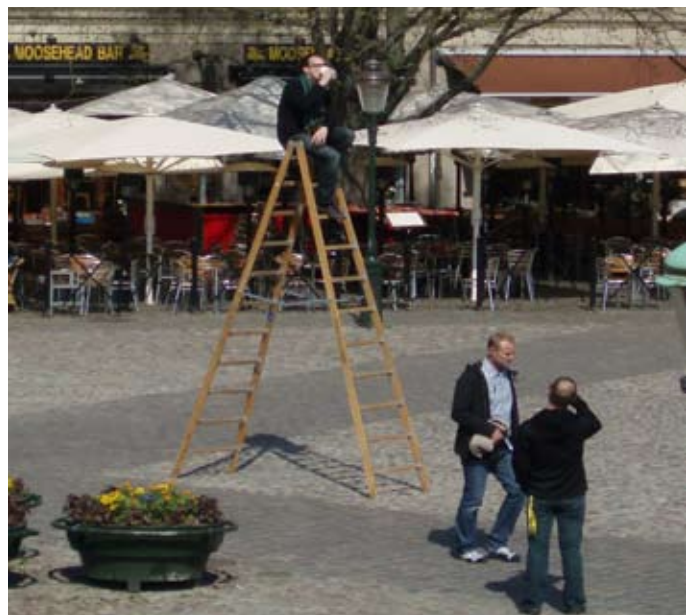
Ny scen på Lilla torg. FC Syd bjuder på kaffet.